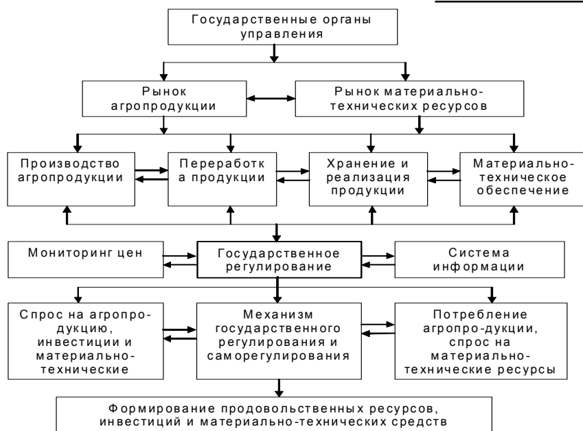
Рисунок 1. Система государственного регулирования и саморегулирования рынка агропродукции и материально-технических ресурсов